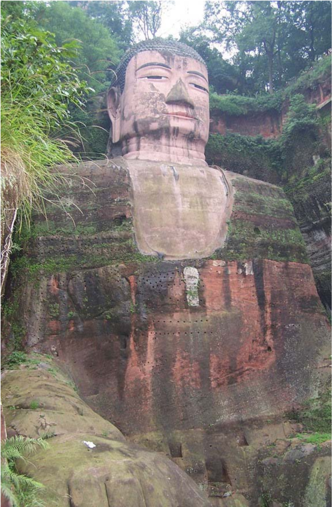
Người dân sống ở khu vực này cho biết, dãy núi nơi tạc tượng Lạc Sơn Đại Phật có hình dáng Phật đang ngủ.