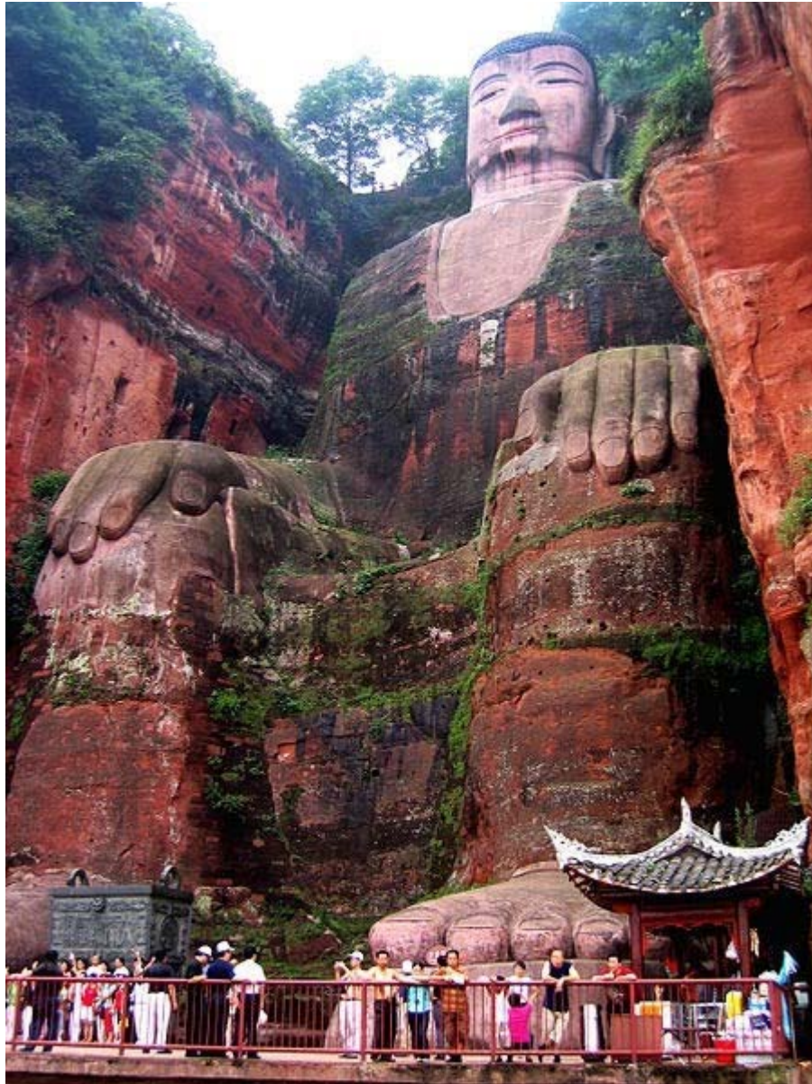
Đầu tượng có 1.021 búi tóc trong khi một người trưởng thành ngồi lọt móng tay nhỏ nhất của bức tượng.